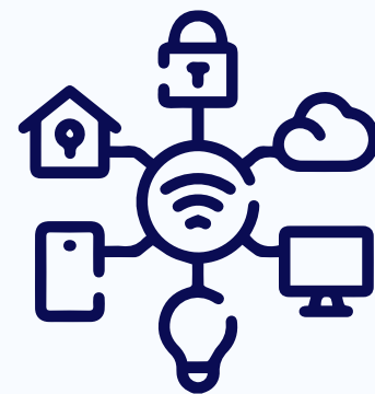
Gestión judicial inteligente